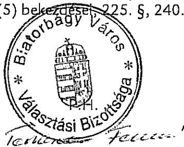
Temesvári Ferencné Biatorbágy Város Választási Bizottság Elnöke

A jogorvoslati jogról szóló tájékoztatást választási eljárásról szóló 2013. évi XXXVI. törvény 221. § (1) bekezdése, 224. § (1)-(5) bekezdése, 225. §, 240. § alapján biztosította.