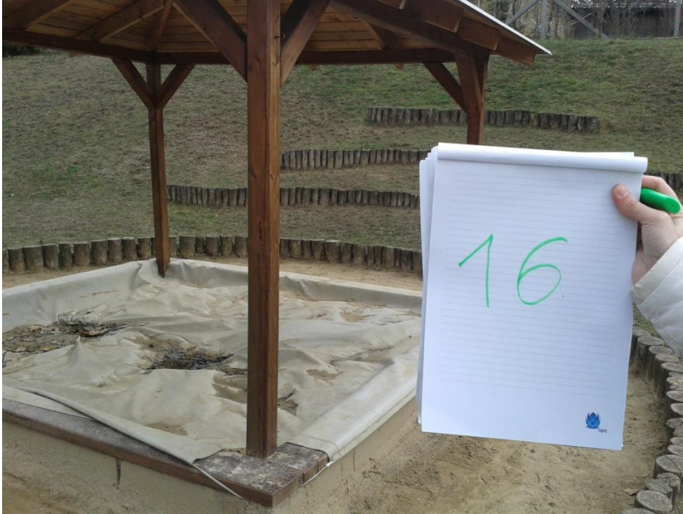
16. számú eszköz – Homokozó

Az eszköz nem szorul javításra, a szabványoknak és biztonsági előírásoknak megfelel.