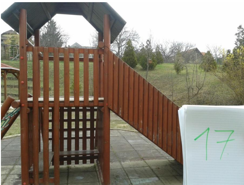
17. számú eszköz – Kuckós mászótorony

Az eszköz nem szorul javításra, a szabványoknak és biztonsági előírásoknak megfelel.