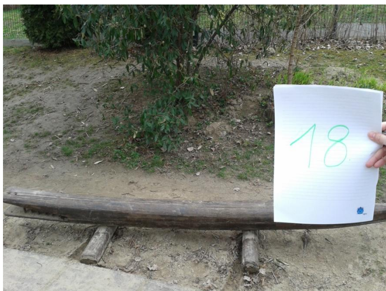
18. számú eszköz – Fa krokodil

Az eszköz nincs biztonságosan elhelyezve ill. rögzítve, ezért balesetveszélyes.