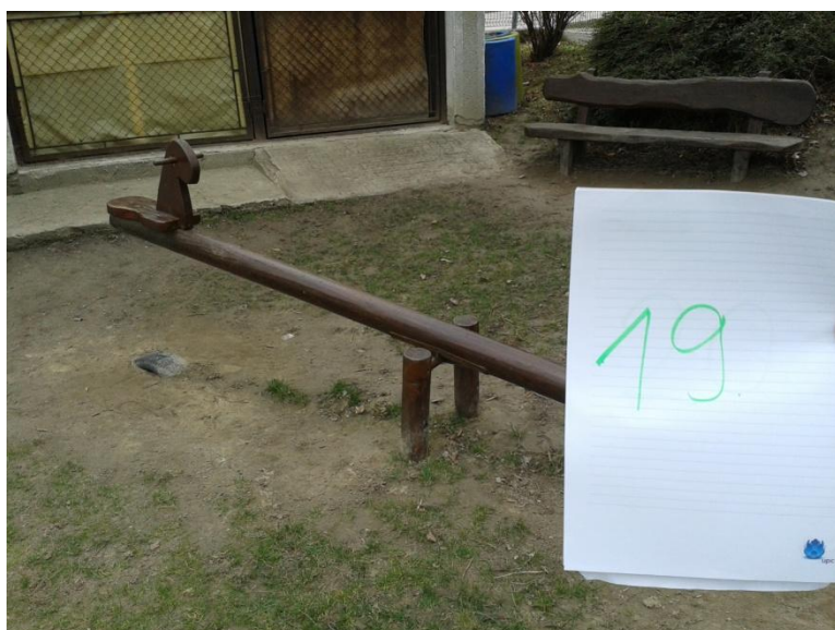
19. számú eszköz – Lovas fa mérleghinta