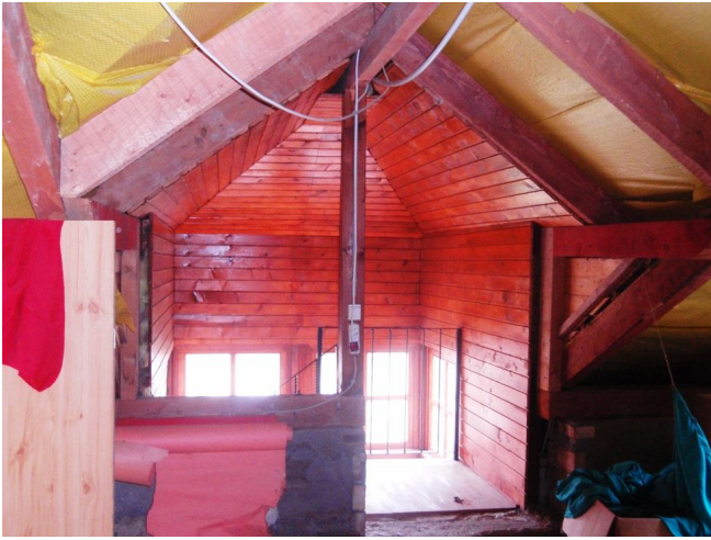
1.számú kép: tetőtér bejárata