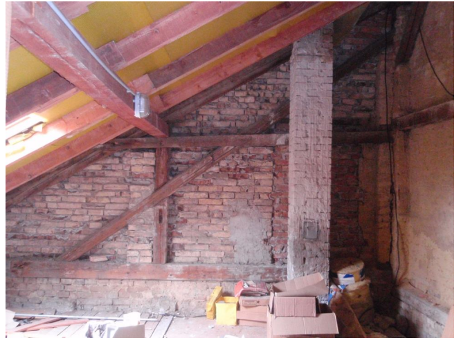
2. számú kép: keleti tűzfal