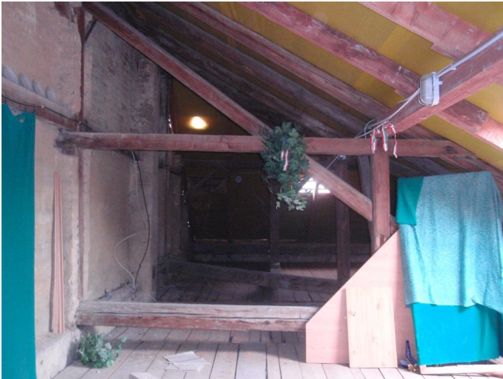
3. számú kép: tetőtér belső kép