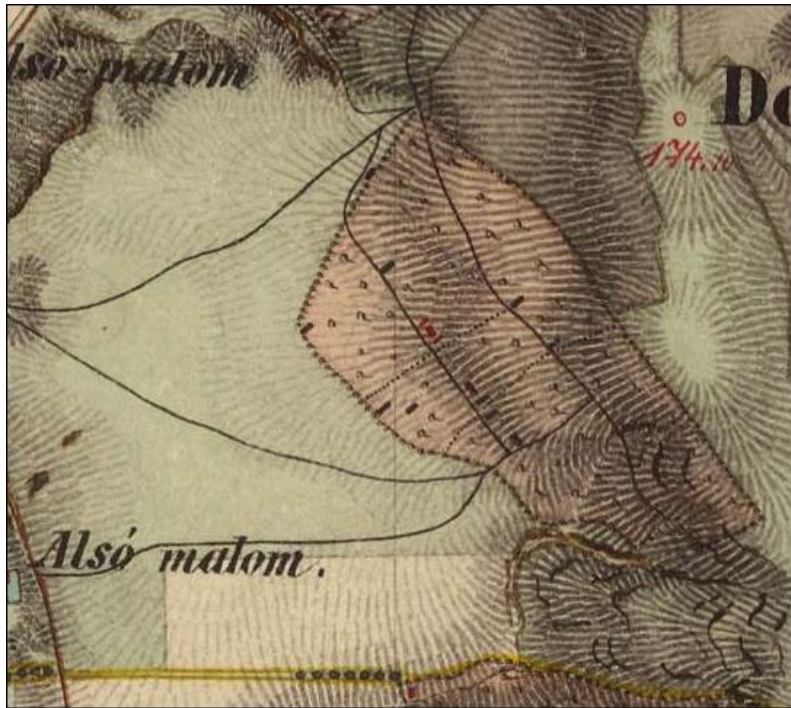
2. ábra A II. katonai felmérés térképe (1806-1869)