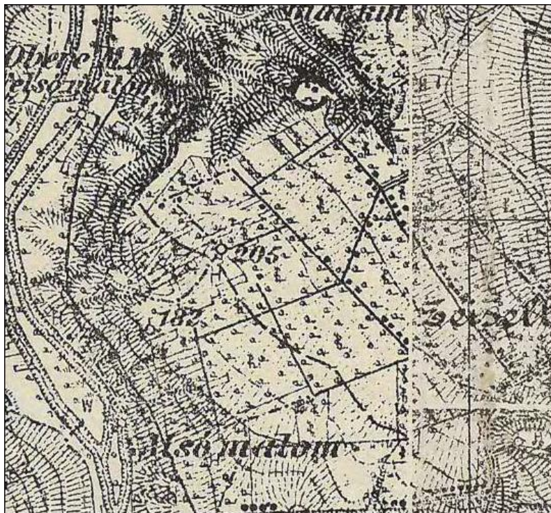
3. ábra A Magyar Királyság III. katonai felmérésének térképe (1856-1887)