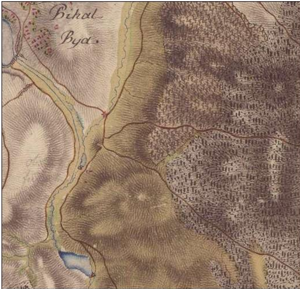
1. ábra Az I. katonai felmérés térképe (1763-1787)