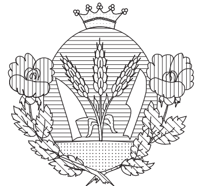
Biatorbágy címerének fekete-fehér ábrázolása a heraldika szabályai szerint.

A képviselő-testület indokoltnak tartotta Bia és Torbágy történeti jelképeinek visszaállítását. Ennek érvényesülését az elfogadott, s azóta hivatalossá lett tervezetben látta.