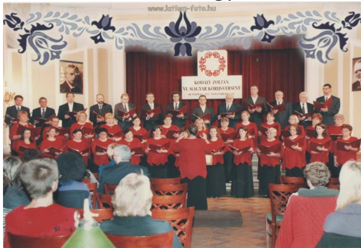
A Pászti Miklós Vegyes Kórus 1992-ben alakult.

Az együttes az eltelt idő alatt a közös éneklések, koncertek, kirándulások során igazi közösséggé kovácsolódott, a régió és Biatorbágy kulturális életének egyik meghatározó szereplőjévé vált. Több mint 15 éve rendezik a Pászti Miklós Alapítvánnyal karöltve - névadójukra emlékezve - a „Pászti Napokat”, melynek műsorát mindig más-más vendégkórus meghívásával színesítik. A sok hazai énekkar mellett így került sor francia, német, Szerbiából a nagybecskereki, Szlovákiából pedig Senica város kórusának vendégszereplésére Biatorbágyon.