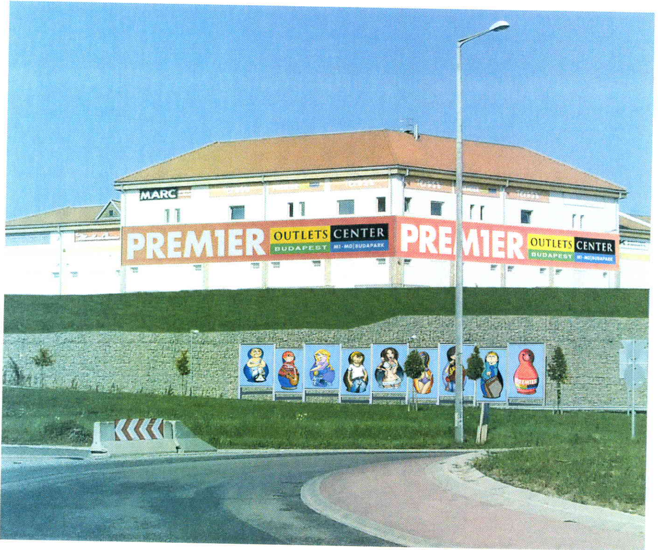
100813_POCG_reklam_v.jpg Content-Description: 100813_POCG_reklam_v.jpg Content-Type: image/jpeg Content-Encoding: base64