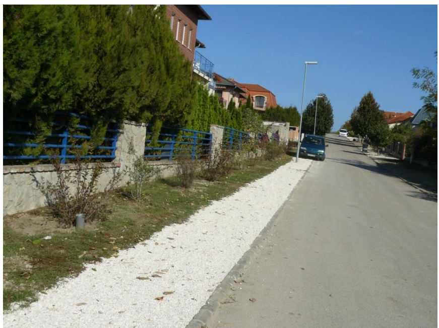
Ritsmann Pál utca felőli zöldfelület és padka