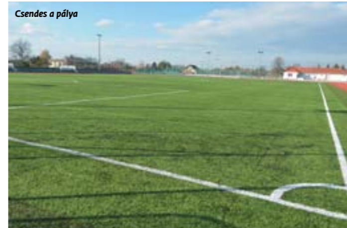
Csendes a pálya

A feleket ezen a „mérkőzésen” a kölcsönös tisztelet és odafigyelés jellemezte. Mindez remény arra, hogy mielőbb elfogadható megoldás szülessen, akár a pályahasználati, akár a közlekedési problémák tekintetében.