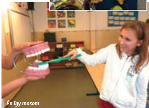
Én így mosom