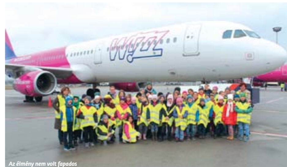
Az élmény nem volt fapados

tott régi gépekbe, még a vezetőfülkébe is, ahol egy reptéri munkatárs teljes részletekkel válaszolt a gyerekek számtalan kérdésére a műszerfal tekintetében. Ezután következett a meglepetés! Buszunk-