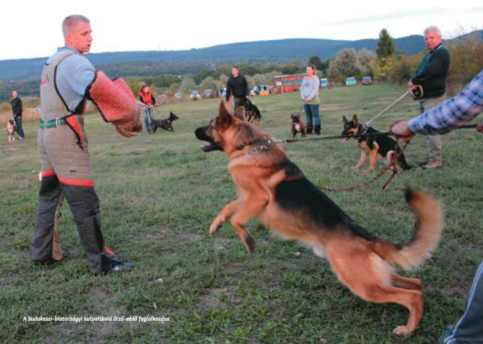
A budakeszi-biatorbágyi kutyaiskola őrsz-védő foglalkozása