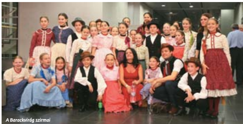
A Barackvirág szirmai

Tavasszal volt a területi selejtező Szekszárdon, ahol lehengerelte a zsűrit: maxi-