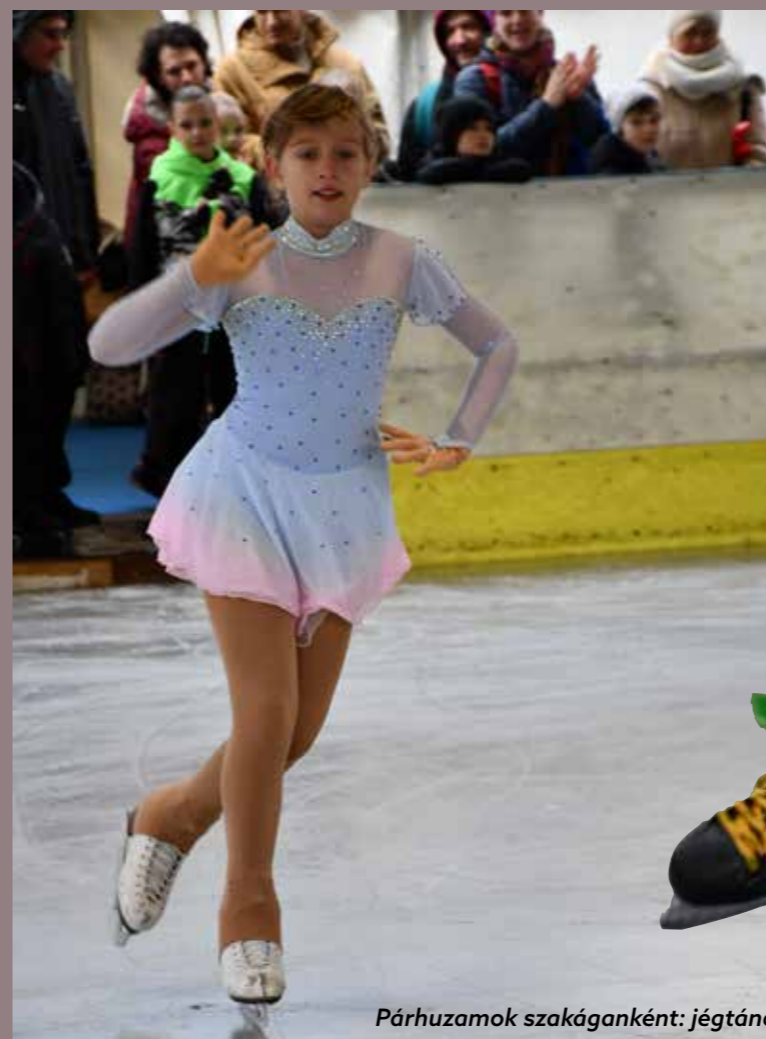
Párhuzamok szakáganként: jégtánc- és hokialapok