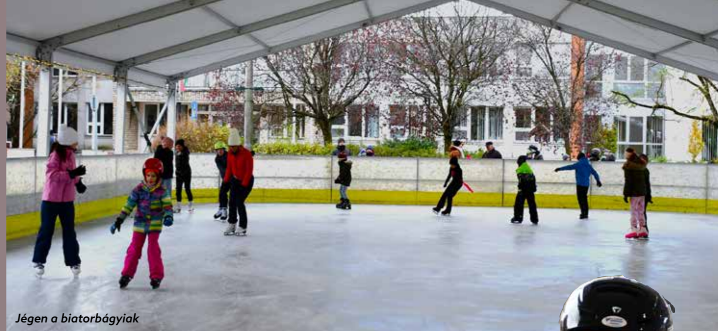
Jégen a biatorbágyiak

állva annak üzemeltetési költségeit. A város apraja-nagyja itt lelheti örömét a népszerű téli sportok valamelyikében.