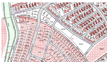
2016. évi Hész.

A lenti 2 kép mutatja, hogy a 2016. és 2021. évben készült rendezési tervek. A két képen jól látható, az a telekcseré, mely a csapadékvizek elvezetése és az összefüggő zöldterületek biztosítása miatt vált szükségessé és valósult meg néhány évvel ezelőtt. A Z-1-el jelölt területek az Önkormányzat tulajdonban lévő területek.