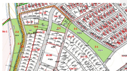
2021. évi Hész.