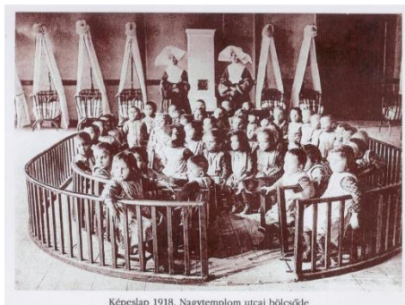
Képeslap 1918. Nagytemplom utcai bölcsőde

Közismert, hogy az első bölcsődét, Jean Firmin Marbeau (1798–1875) francia gyermekbarát kezdeményezésére, 1844. november 4-én alapították Párizsban. Nyolc évvel később, 1852. április 21-én nyitotta meg kapuit az első magyar bölcsőde Pesten, a Kalap utca 1. szám alatt. A kezdetekben jótékonyági alapon működtek a bölcsődék. Egy-egy ágy finanszírozását egész éven át gazdag családok biztosították.