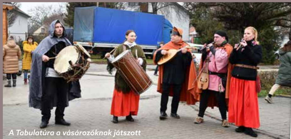
A Tabulatúra a vásározóknak játszott