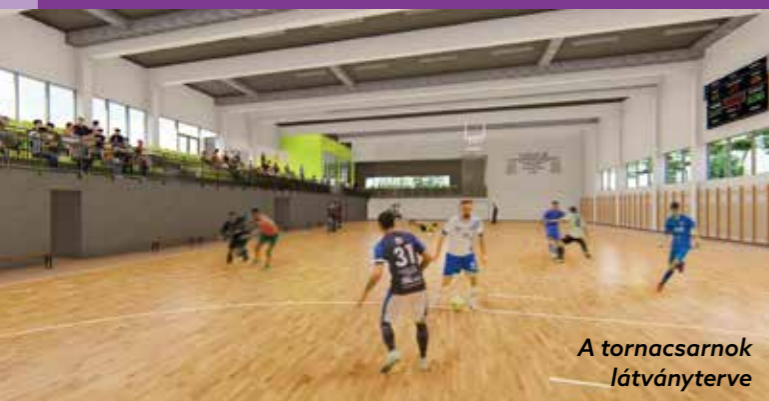
A tornacsarnok látványterve