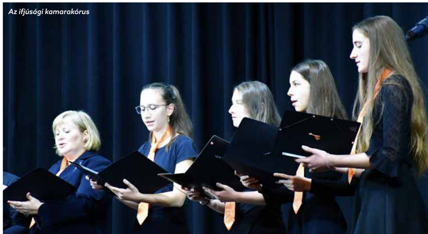
Az ifjúsági kamarakórus