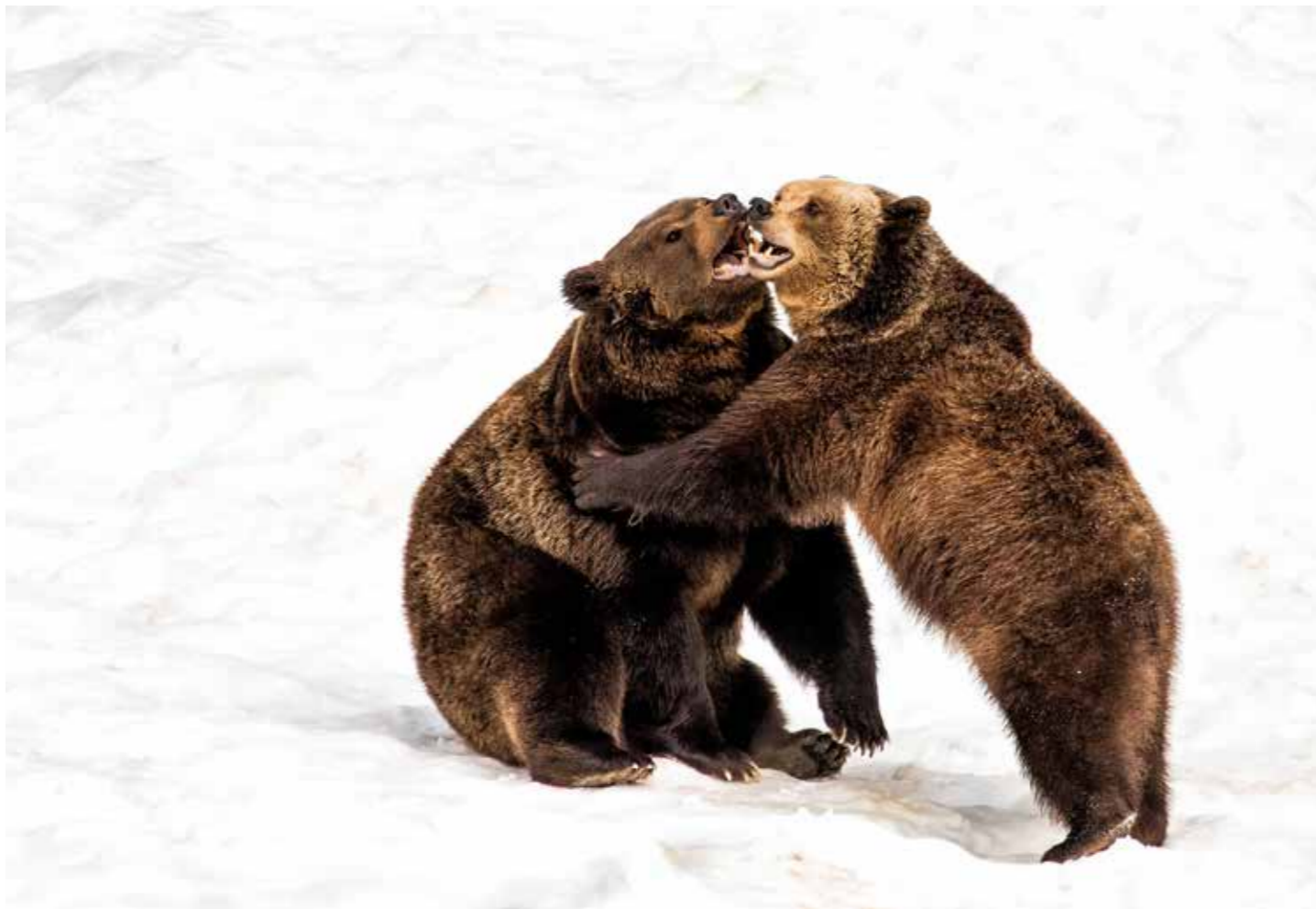
Révész László: Testvérek. A fotó a Bajor-erdő (Bayerischer Wald) területén készült, két medvebocs önfelédtt játékát örökíti meg.