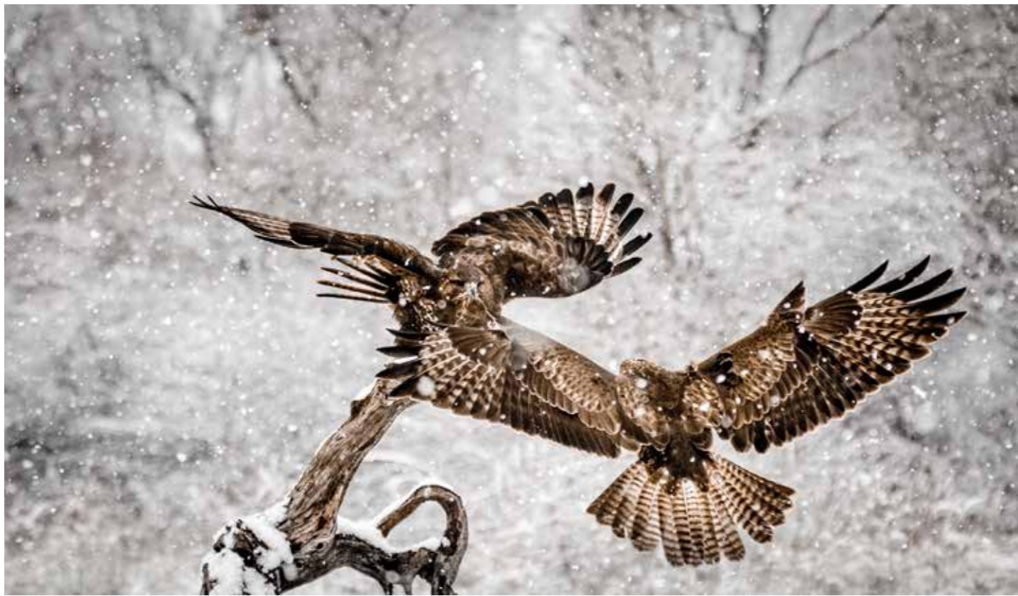
Kiss Borbála: Riválisok. A fotó egy különleges nap eredménye. Reggel, amikor a helyszínre érkeztünk, még nyoma sem volt a hónak. A kismadarak csiripeltek, keresték a magokat. Egyszer csak csönd lett, és megjelent a két egerészölyv, akik szintén éhesek voltak. Megindult a küzdelem a táplálékért, ami a havazással együtt nagy élmény volt! Ezt örökítette meg a kamerám.