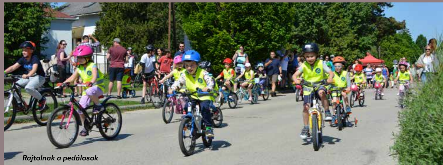
Rajtolnak a pedálosok