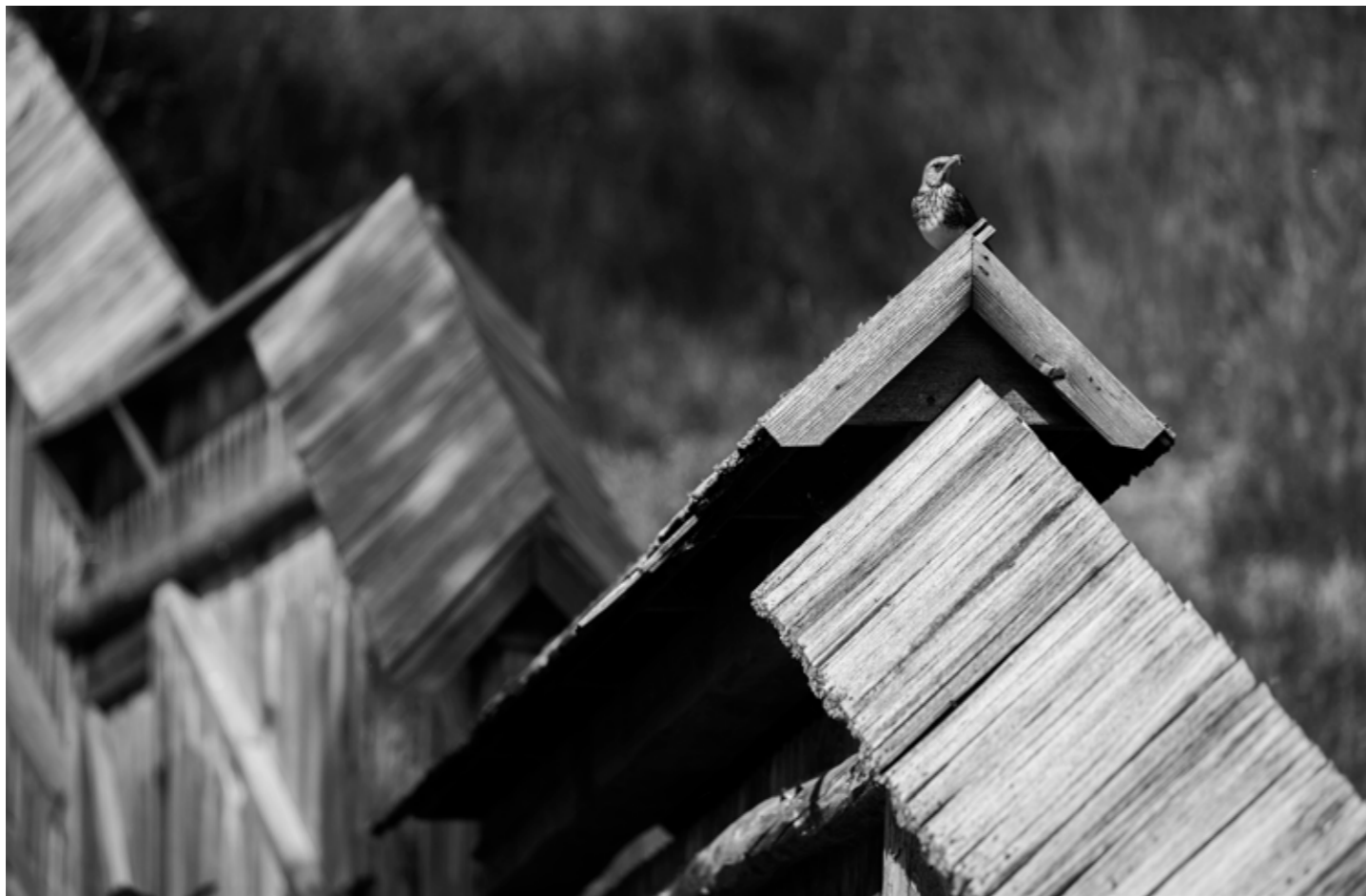
Tonomár Mónika: Fenyőrigó. Gyergyóremetei kirándulásunk során a helyi fotóklub tagjai az eszenyői vízimalmokhoz is elkalauzoltak bennünket. A képen a vidéken gyakori fenyőrigó pihent meg épp a malmot határoló, jellegzetes zsindeyes kerítésen.