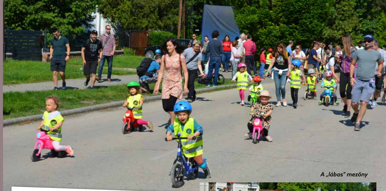
A „lábás” mezőny