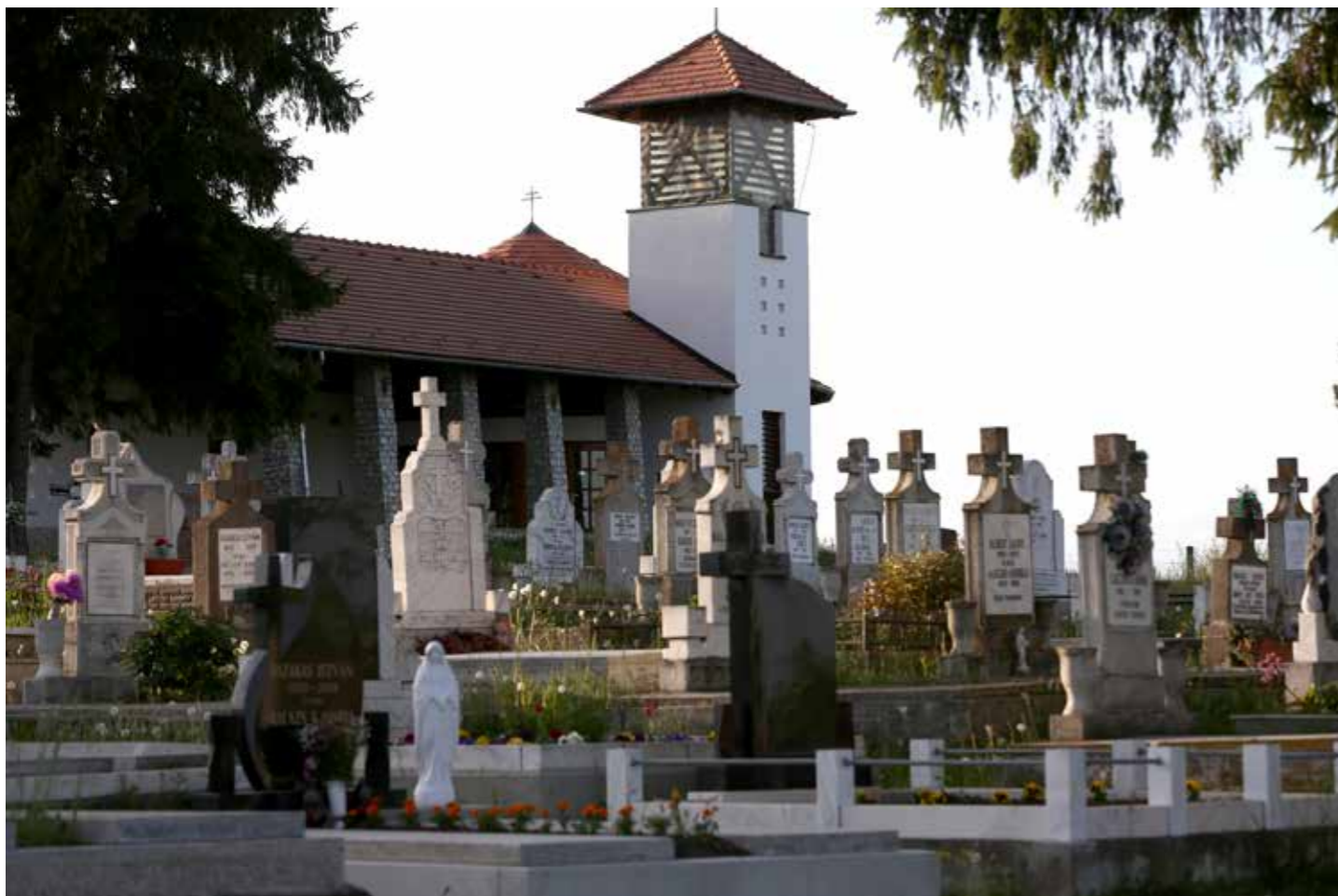
Gyapjas Ferenc: Temető. A temető a lélek átjárója két világ között. Ahogy a lemenő nap még megvilágítja a keresztek, az emlékezetünkben felvillannak az emlékek, még velünk vannak...