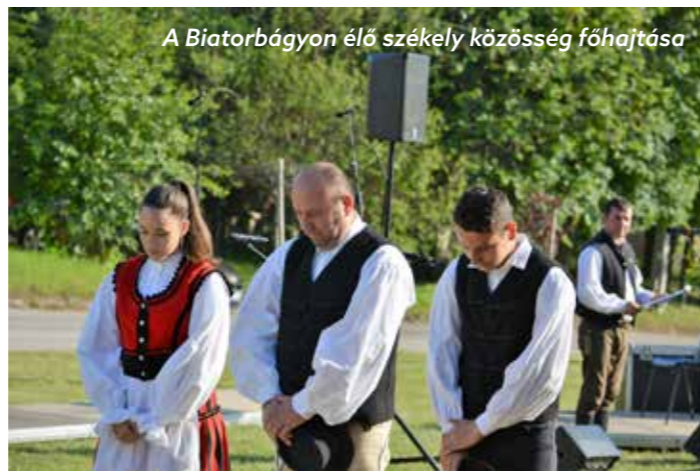
A Biatorbágyon élő székely közösség főhajtása