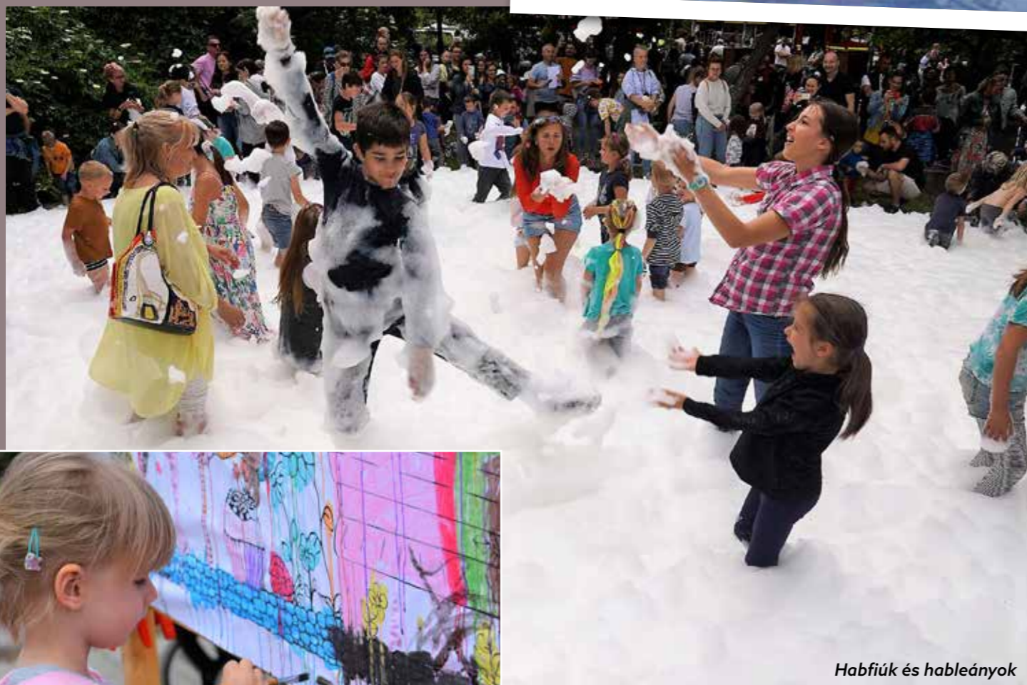
Habfiúk és habléányok