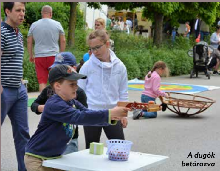
A dugók betárazva