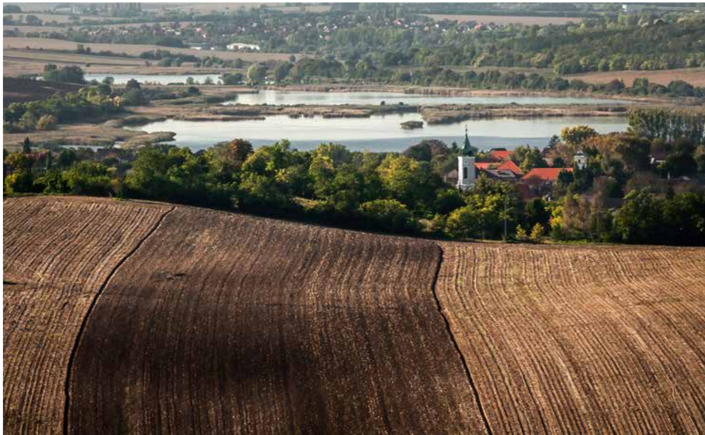
Mátrai Sándor: Felsőmajori lankák. Egy szeptemberi napon ellátogattunk a kedvelt, szép kilátást nyújtó Nyakas-kő, Madárszirt kirándulóhelyre. Fentről tágas kilátás nyílik a vidékre, a városra, a Biai-tóra. A kép előterében lévő földön már elvégezték az őszi mélyszántást, amely a teleobjektív-perspektíva tömörítő hatása miatt úgy tűnik, mintha meredek domboldal lenne.