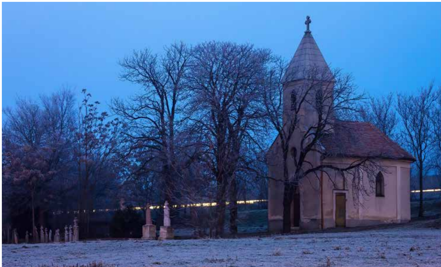
Kristóf István: Kápolna. A fotót a Sarlós Boldogasszony-kápolnáról a 2013-as esztendő első napján készítettem. Szép, deres volt a táj, ami különleges hangulatot kölcsönzött a helyszínnek. Napnyugta után az állványra helyezett fényképezőgéppel harminc másodpercig készült a felvétel, így a háttérben az autópályán elhaladó autók lámpái érdekes fénycsíkot húztak.