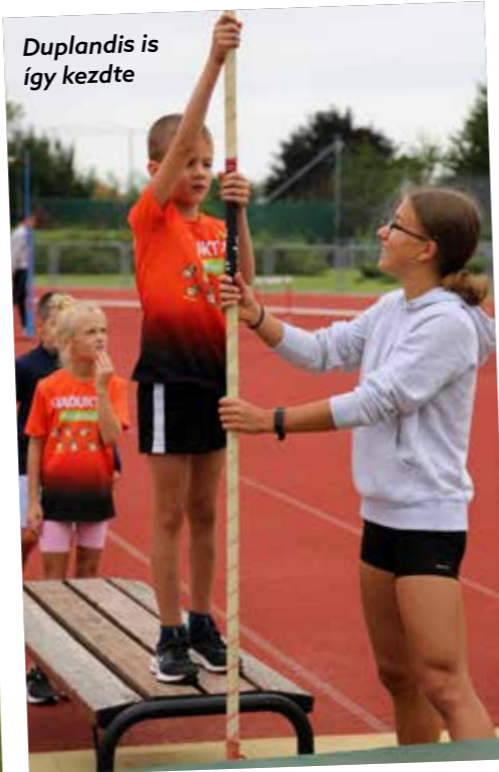
Duplandis is így kezdte

A szakosztályokról, sportolási lehetőségekről és edzésidőpontokról bárki tájékozódhat az egyesület honlapján: Viaduktse.hu .