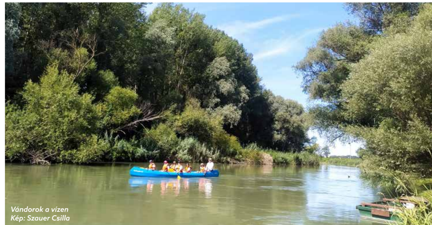
Vándorok a vízen