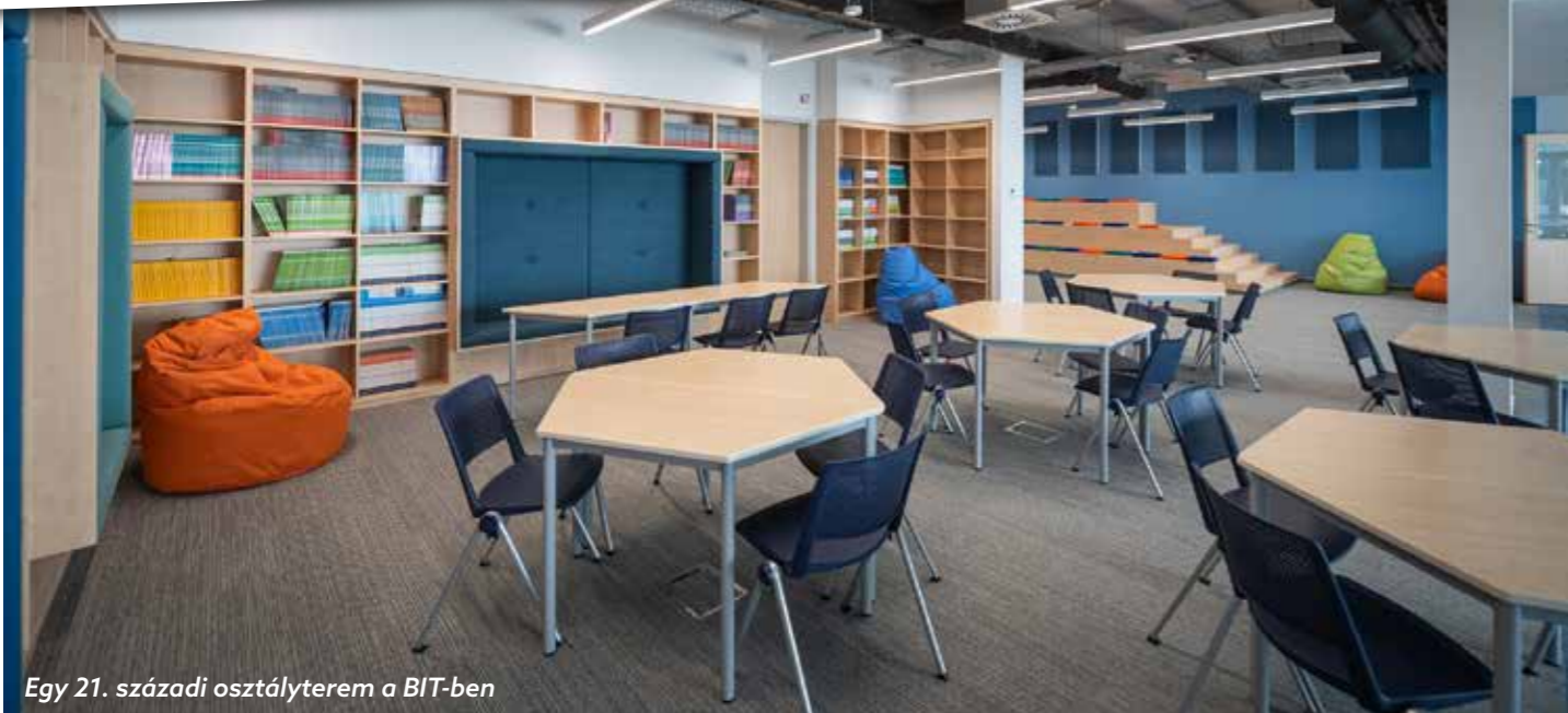
Egy 21. századi osztályterem a BIT-ben