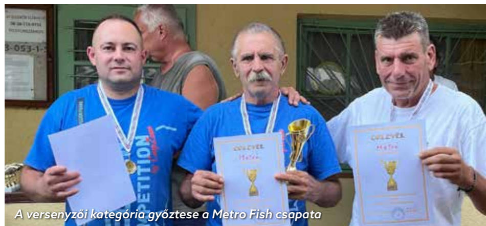
A versenyzői kategória győztese a Metro Fish csapata