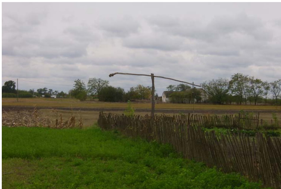
Gémeskút (Szentkirály Jászdűlő)