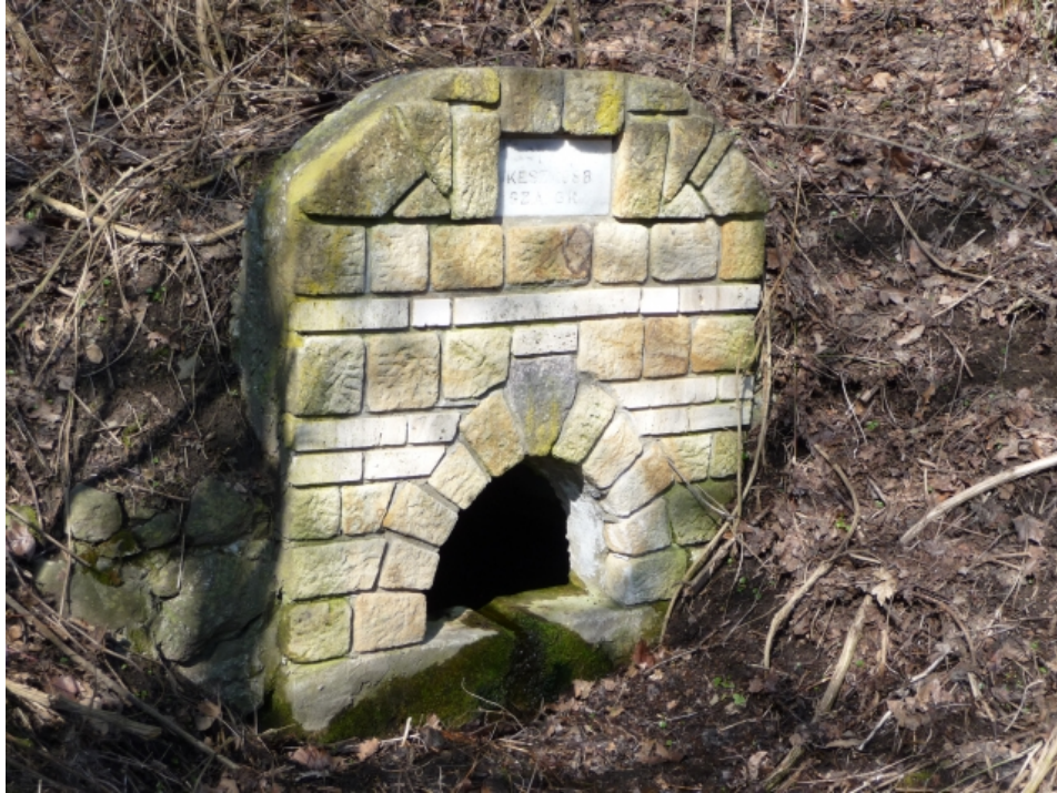
Forrásfoglalás (Márianosztra)